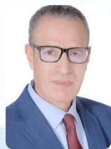
Pr. Bouchta ELMOUMNI Président de l'Université Abdelmalek Essaâdi